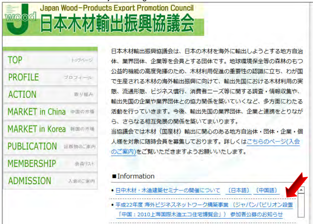
図4. 情報発信に利用した国内外のウェブサイト (3)