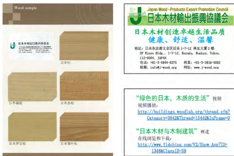
図5. 配布用国産材カタログ(左)とPRカード(右)

ジャパンパビリオンの来場者、セミナーの参加者に対して、図5に示す国産材カタログ(主要樹種のツキ板サンプルを添付)200部、PRカード500枚を配布し、効果的なPRに努めた。