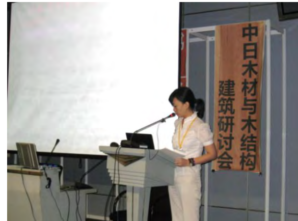
出展者 製品・技術説明 株式会社タカヤマ