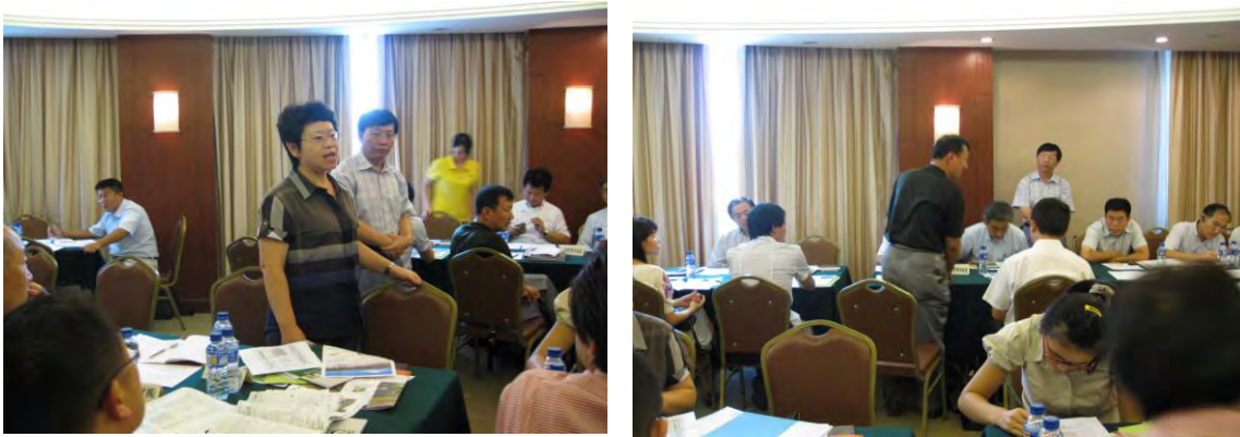
写真7. 商談会（マッチング商談）の実施状況