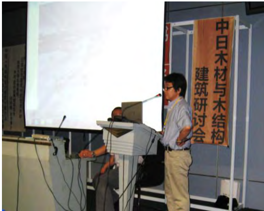
出展者 製品・技術説明 徳田銘木株式会社