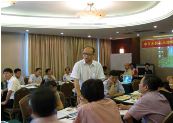
現地業者の上海福人林産品卸売市場の説明