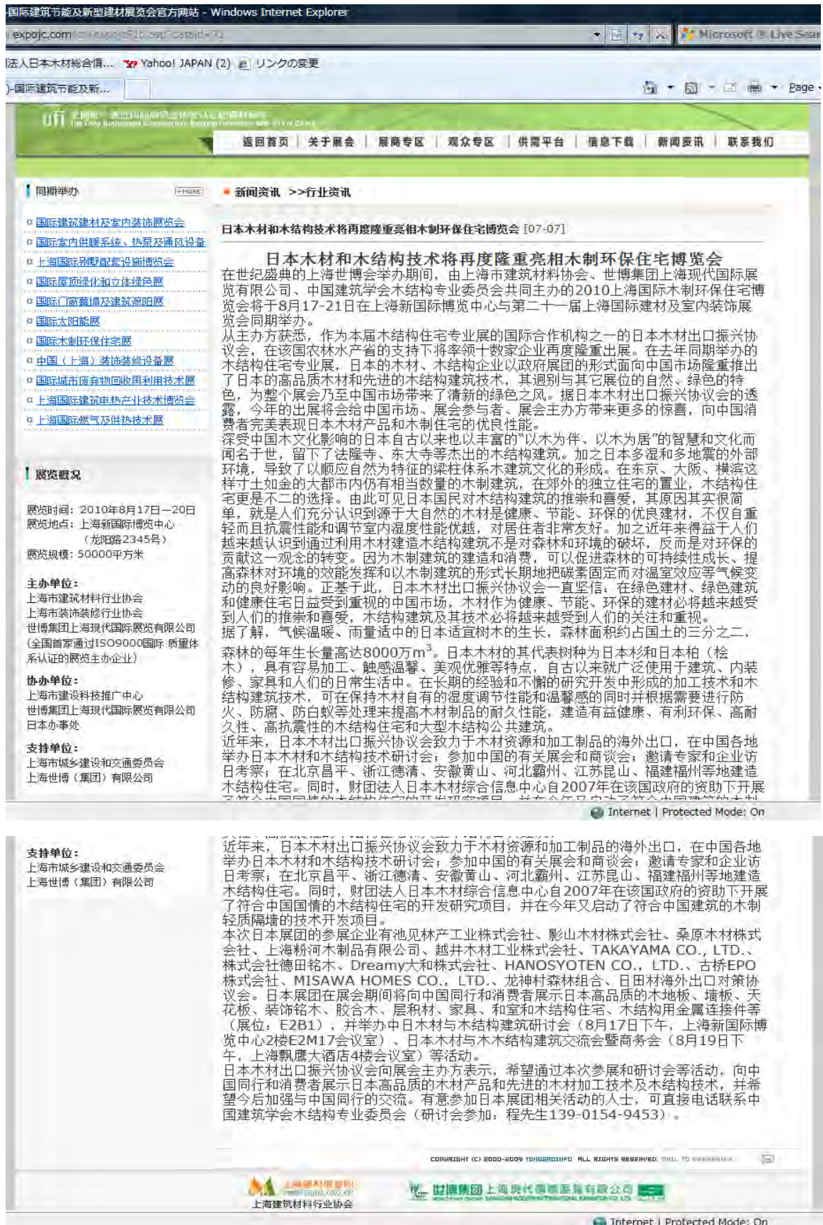
图3. 掲載・配信済の事前企画記事(2)