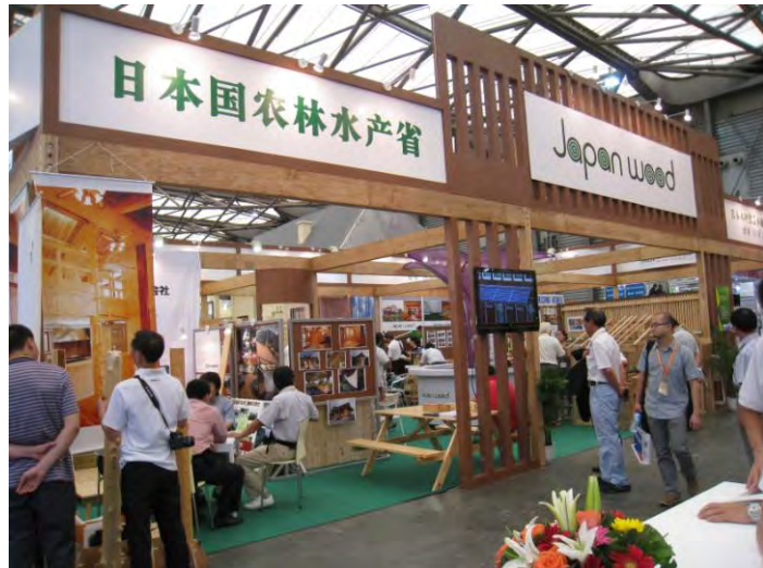
写真8. DVD上映による国産材製品の広報

ジャパンパビリオン正面の入口に設置した大画面ディスプレイでPR用DVD「ウディな日本、ウディな生活」(中国語版)を上映し、来場者に対し国産材や出展した木材製品に対する理解・認識を深めてもらうことに努めた。