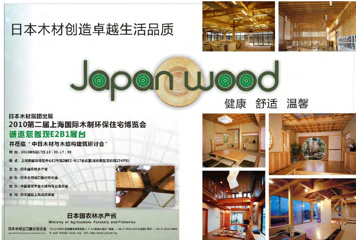
图 2. 掲載済の告知広告

中国木材業界専門誌「中国木材」(2010 年第 3 号) を通じて木材流通・貿易・加工業者等に向けて、国産材製品や木造住宅に関する告知広告 (A3 版折りたたみ式、カラー、表紙 1) の掲載により、国産材製品の認知度を高めるとともに、現地の潜在的な商談相手等に対して、ジャパンパビリオンの出展・セミナー開催及びその内容に関する告知に努めた。