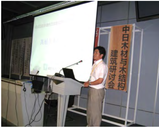
出展者 製品・技術説明 越井木材工業株式会社