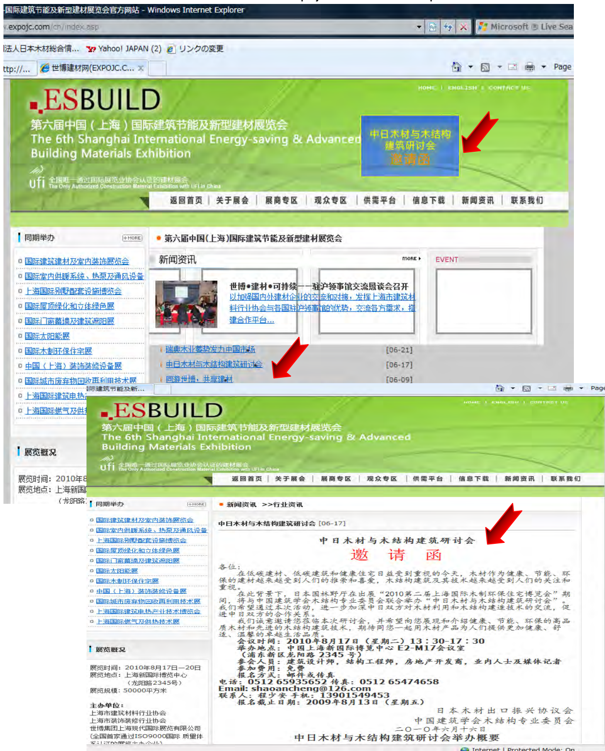
图 4. 情報発信に利用した国内外のウェブサイト (1)

「木造エコ住宅博覧会」ウェブサイト (www.expoj.com/cn/index.asp)