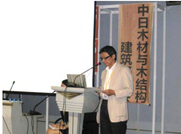
出展者 製品・技術説明 ミサワホーム株式会社