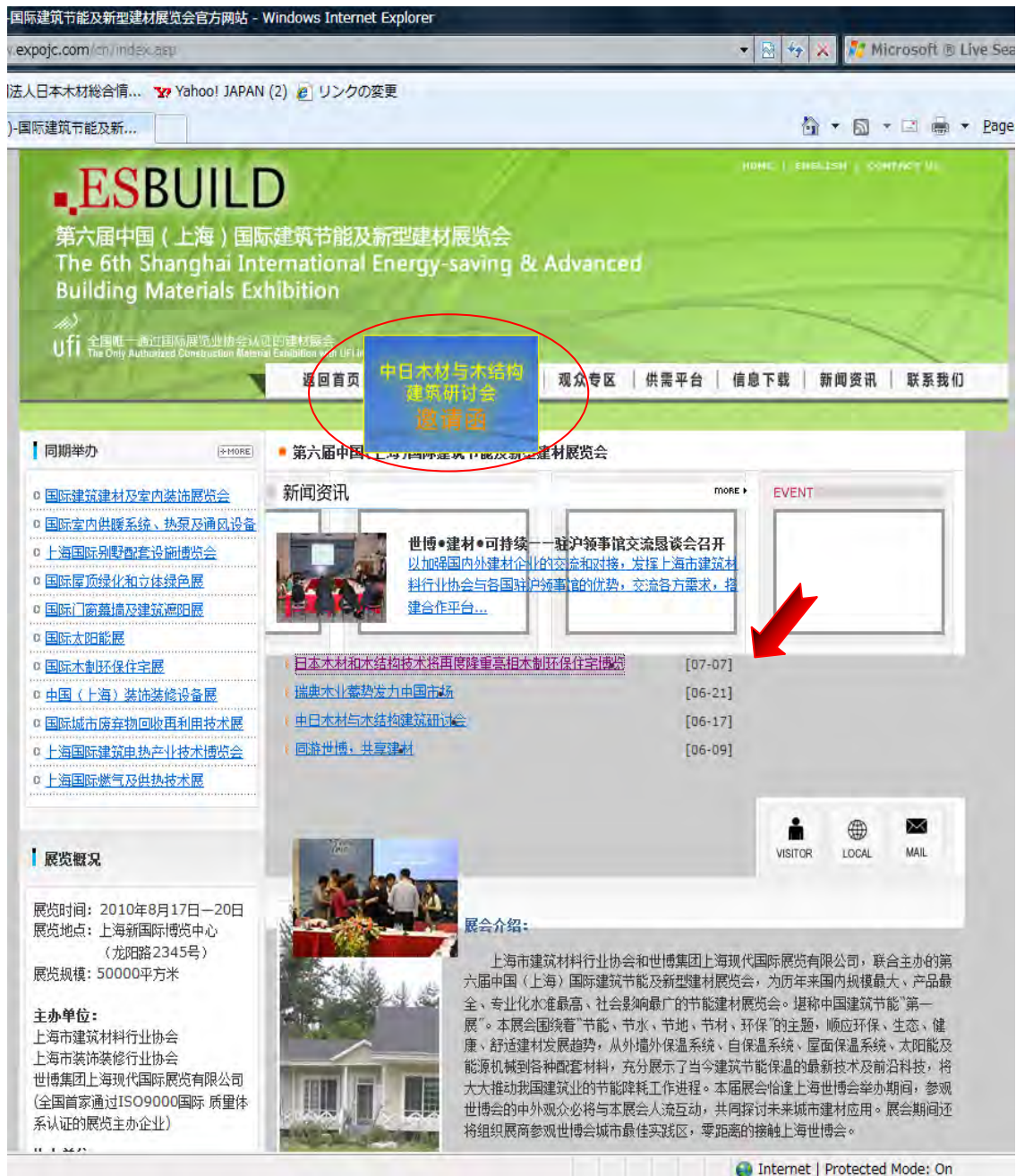
図3. 掲載・配信済の事前企画記事（1）

「日本木材和木结构技术将再度隆重亮相木制环保住宅博览会」（日本産木材・木造技術再度木造エコ住宅博覧会出展）をタイトルとした中国語版の事前企画記事は2010年7月7日より、「木造エコ住宅博覧会」のオフィシャルウェブサイト（世博建材網：www.expoj.com/cn/index.asp）に掲載されている。