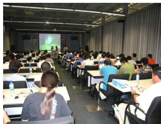
セミナー受講状況