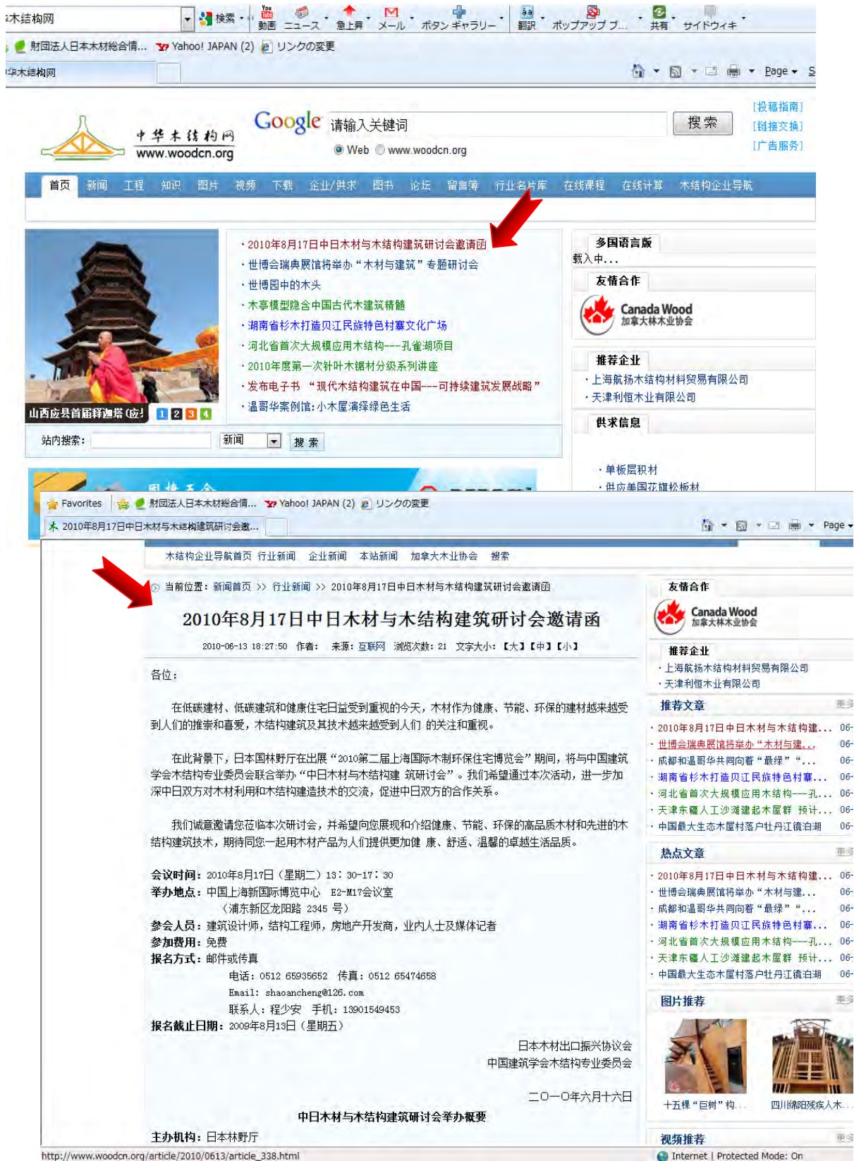
图 4. 情報発信に利用した国内外のウェブサイト (2)