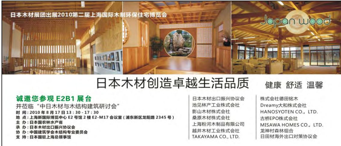
图 1. 配布済の PR 用入場券 (裏面)