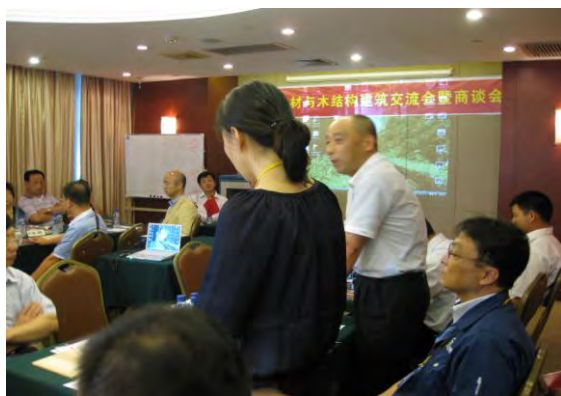
出展者の株式会社タカヤマの説明