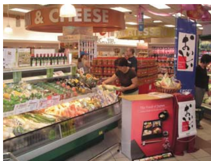
グレートワールドシティー店