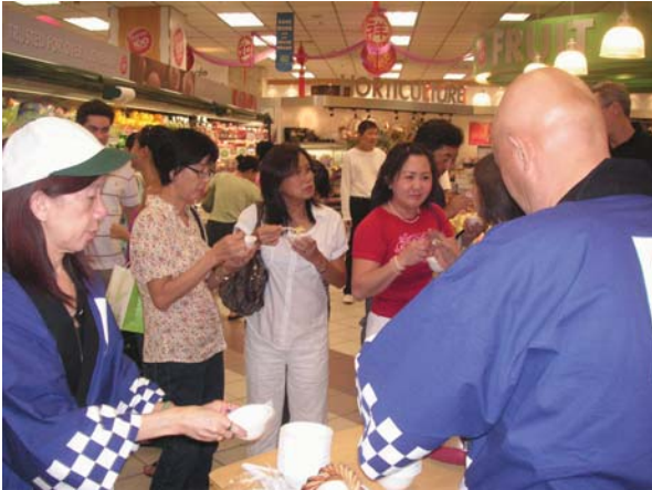
グレートワールドシティ店