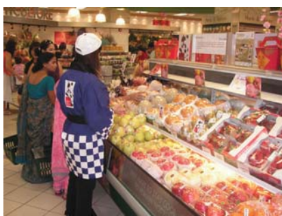
グレートワールドシティー店