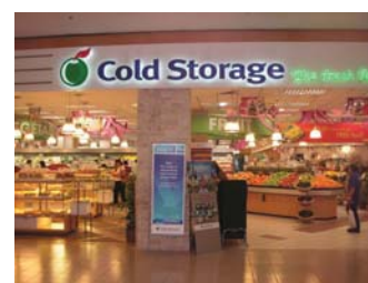
グレートワールドシティ店