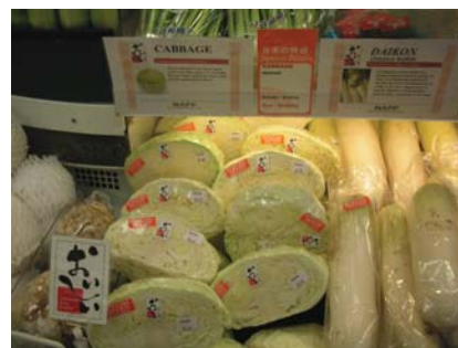
グレートワールドシティー店