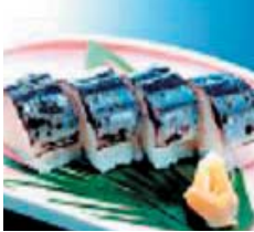
①あぶりさんま ②株式会社 阿部長商店(宮城県)