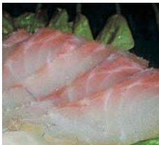
①真鯛冷燻 ②大松屋(三重県)