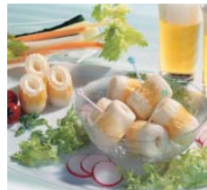
①チーちく ②株式会社 紀文食品(東京都)