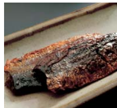
①にしんうま煮(TERiyAKI FISH) ②株式会社 平松食品(愛知県)