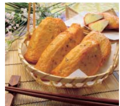
①チーズ棒 ②若松屋(三重県)