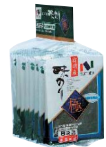
①味極8袋 ②ニコニコのり株式会社(大阪府)