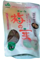
①チョーヤ 梅の笑 ②紀南農業協同組合(和歌山県)