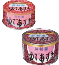
①ゆであずき特6号缶 ②井村屋製菓株式会社(三重県)