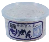
①そのまんまちりめん ②株式会社 セトクィーン(愛媛県)