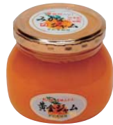
①紀の国田みかん 黄金ジャム ②株式会社 早和果樹園 (和歌山県)