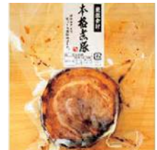
①煮豚ブロック ②クラタ食品有限公司(広島県)