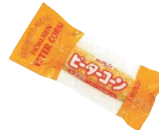
①ホクレン レトルトピーター コーン ②ホクレン農業協同組合連合会 (北海道)