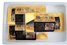
①鯖の冷燻 ②(株)ディメール(青森県)