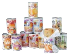
①アキモのパンの缶詰、 カンカンブレッド スペースブレッド® ②株式会社 ン・アキモ(栃木県)