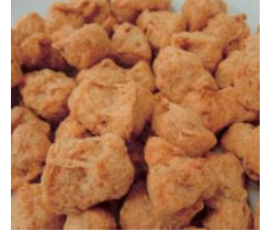
①まんま大豆 肉だんご ②株式会社エヌ・ディースー(岐阜県)