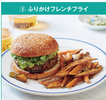
② ふりかけフレンチフライ