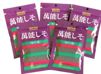
台湾へ輸出している「ゆかり®」