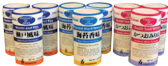
主に米国へ輸出しているふりかけ