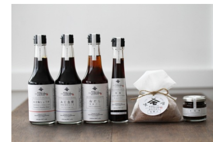
リパッケージした商品群

欧米諸国や先進国との取引を目指し、更なるブランド化を目標とする。 日本の伝統産業に新たな活路を見出す。