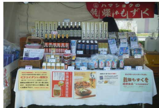
輸出している各種の商品

これまでの輸出先に加えて中国へも輸出を拡大する他、インターネット注文による販路の更なる拡大を目指す。また、拡大する需要に対応するため、県内モズクの安定的な確保にも併せて取り組む。