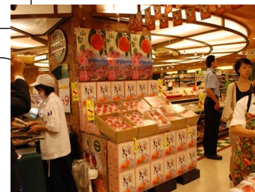
現地でフェアを実施

【ウェブサイト】 http://www.pref.yamanashi.jp/shigoto/nogyo/index.html