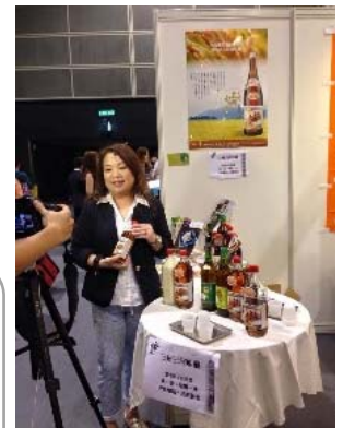
FOOD EXPO2015で 取材を受けている様子