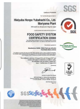
食品安全マネジメントシステムFSSC22000認証取得