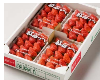
静岡県・静岡経済連と連携して紅ほっぺを香港へ輸出