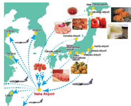
沖縄国際物流ハブの活用により農林水産物を新鮮な状態で輸出