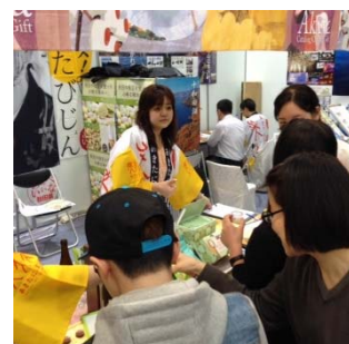
現地展示会での試食販売の様子