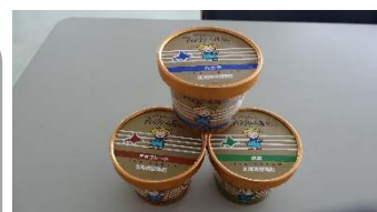
商品「べっかいのアイスクリーム屋さん(チョコレート、バニラ、抹茶味)」