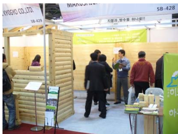
現地展示会での商品説明

【活用した施策・支援】 ジェトロのキョンハンハウジングフェア(平成25年、平成26年、平成27年) ジャパンパビリオンへの参加