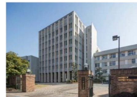
中村学園大学（福岡市）