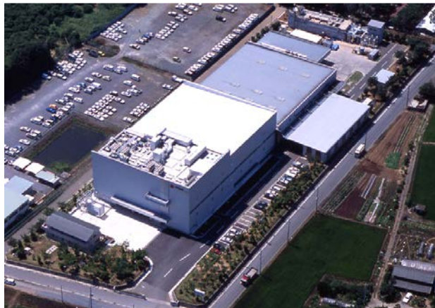
関東 美野里工場（茨城県小美玉市）