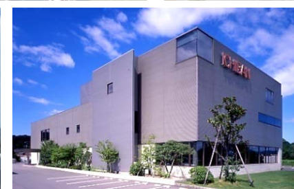
研究開発センター 4