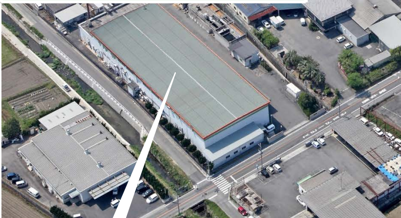
A-one工場（レトルト食品）