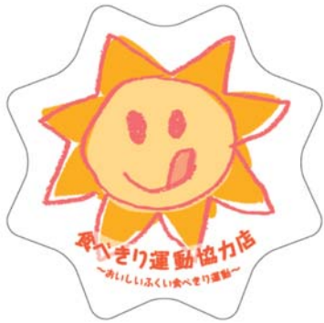
福井県 「のっこさん」