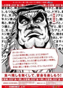
福岡市 「宴会部長 完食一徹」

自治体間のネットワーク構築（H28.10月） （全国おいしい食べきり運動ネットワーク協議会）