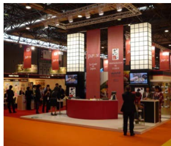
SIAL(仏)ジャパンパビリオンの様子