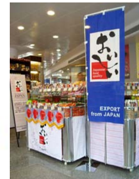
マカオでの常設店舗の様子