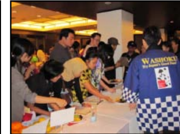
インドネシア(ジャカルタ)