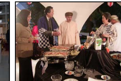
オマーン(マスカット)