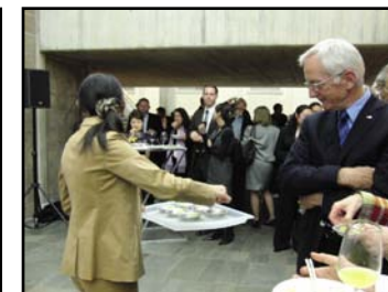
スイス(チューリッヒ)