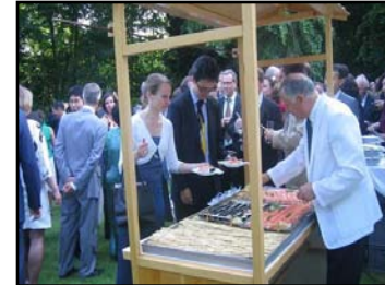
ベルギー(ブリュッセル)