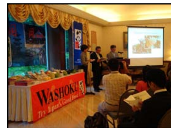
マレーシア(クアラルンプール)