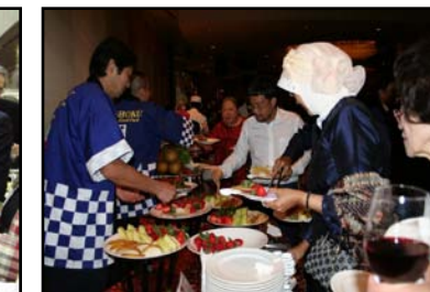
シンガポール(シンガポール)

※提供品目欄に( )を付してある品目は、本事業予算において、広報資料等を提供し、品目の提供はしていない(冠事業として実施)。