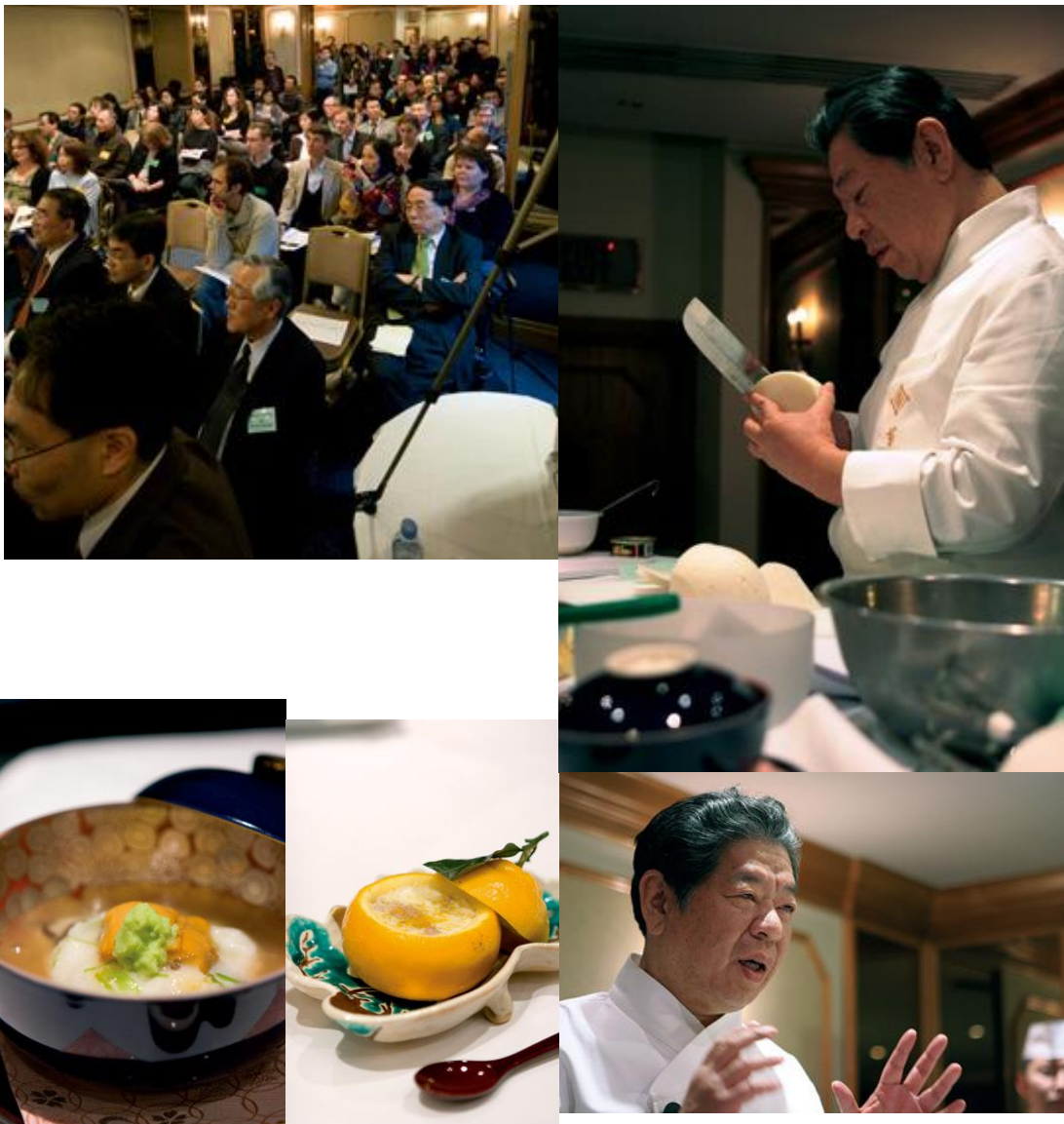
JROロンドン支部設立説明会及び料理人講習会の様子