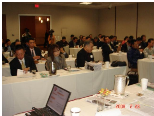
ロサンゼルス支部説明会の様子