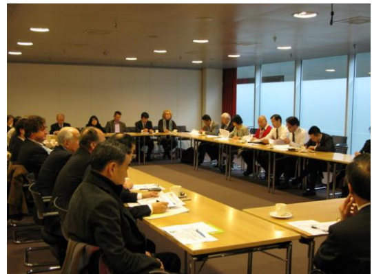
アムステルダム支部説明会の様子