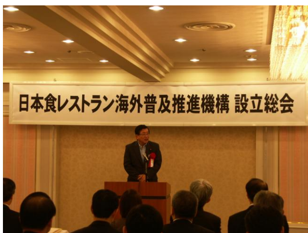
JRO設立総会・記念講演パーティー