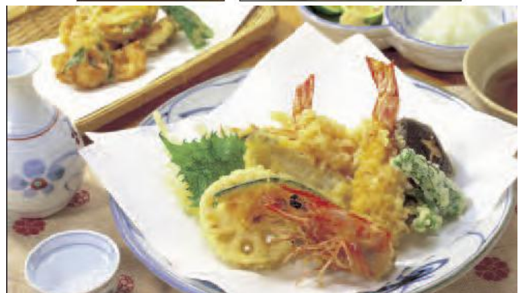
掲載した日本料理 (写真は寿司、天ぷら)