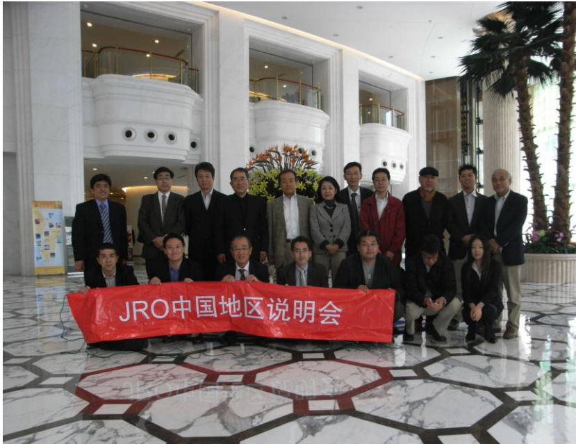
上海における JRO 説明会