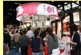
JROの出展ブース(シカゴ)