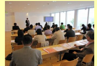
パリ支部設立説明会