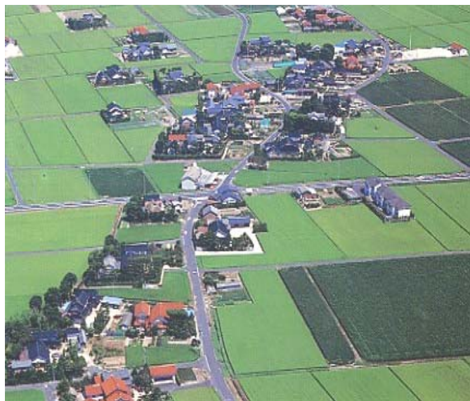
○農地、農業用施設、集落が一体不可分となった農村の姿

農村整備事業は、このような農村において生産条件と生活環境の両方の改善を図るものであり、他の農業振興施策や地域振興施策と併せ、総合的に農村の振興を図ることを通じ、「食料の安定供給の確保」と「多面的機能の発揮」を通じた国民生活の安定向上及び国民経済の健全な発展という農政の基本目標の達成に重要な役割を担うものである。