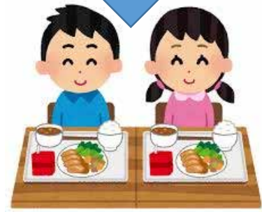
子供食堂など子供の貧困 対策のための事業