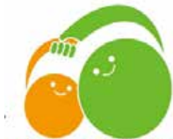
子供の未来は日本の未来 子供の未来応援基金 (民間団体が保有)