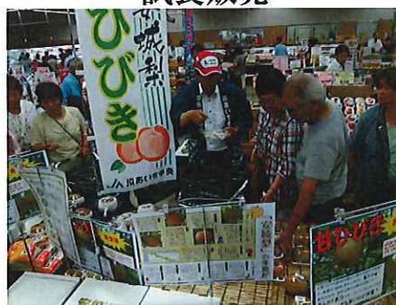
梨の新品種「甘ひびき」の 試食販売