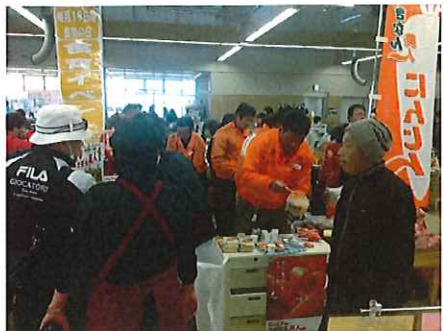
生産者・JA園芸担当・食育ソムリエによる イベント 人参「へきなん美人」の試食販売