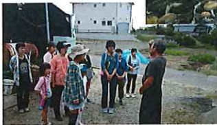
栽培施設で収穫体験