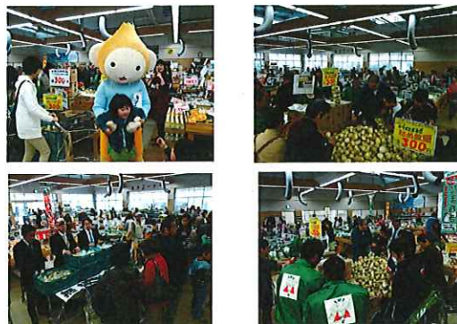
たまねぎ部会「サラダたまねぎ」詰め放題