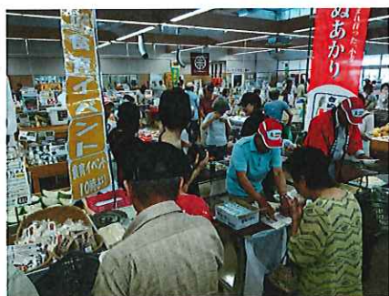
新品種「小麦粉きぬあかり」の 「きしめん」の試食販売