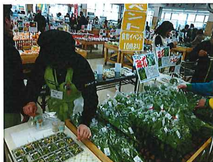
毎月19日は、「食育の日」 食育ソムリエを中心に開催。