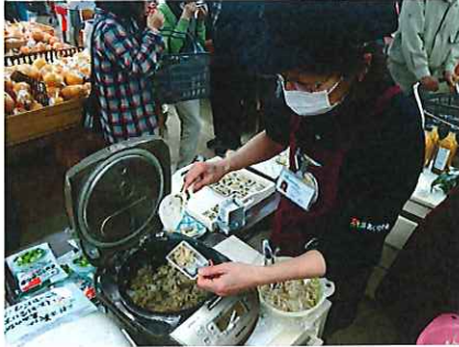
店内に試食ブースを作り、たまねぎご飯の試食