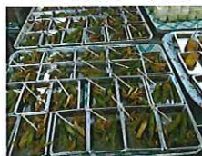
いんげんまめの試食