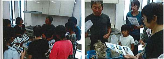
でんまあと料理教室で、「きのこ」(菌床)について勉強をいたしました。