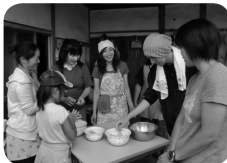
プチファームでの体験が次の活動につながっている

・先日、芋掘り会に参加しました。知らない人たちとおしゃべりしながら一時間ほど掘りまくり……その後お弁当&お茶タイム……楽しかった。私はなんとなく参加しただけなんだけど、みんな食べもののことを真剣に考えてました。農家さんがごちそうしてくれた仙台なすのおみそ汁、ラトウユ、うまかったです。ありがとうございました。おみやげはジャガイモ、たぶん10キロくらい。洗っちゃいけないんですって。今、土がついたままベランダで干してます。何つくろうか、誰に送ろうか、思案中。