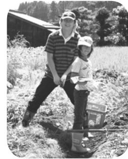
県外から参加の親子