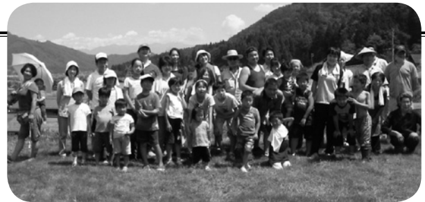
協議会メンバーと参加者の集合写真