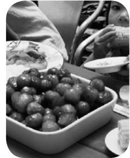
とれたてのトウモロコシとトマト

鮎の瀬農園（体験農場）において、鮎の瀬牧場（酪農）から出る牛の排泄物とオガクズを堆肥化し、鮎の瀬農園のほ場の肥料として活用。収穫した野菜のくずの一部は牛の飼料として与えている。活動が開始された平成20年度からこの循環型農業の実践の場となり、体験者などにも説明されている。