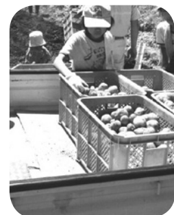
給食用のジャガイモの収穫

参加募集の対象の子どもは小学生としているが、低学年の子どもに加え家族で参加する場合、保育園児や未就園児の参加もあるため、危険を伴う作業は少なくしている。稲刈りの鎌や調理の包丁を使用する場合、作業の開始前には、作業の説明とともに安全に作業するための注意事項が指導者から説明されている。また、保護者同伴による参加を必須としている。