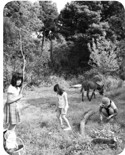
農家の動物—ロバ・ヤギ・犬・鶏を体験メニューに