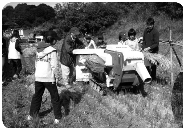
体験作物はイネと大豆