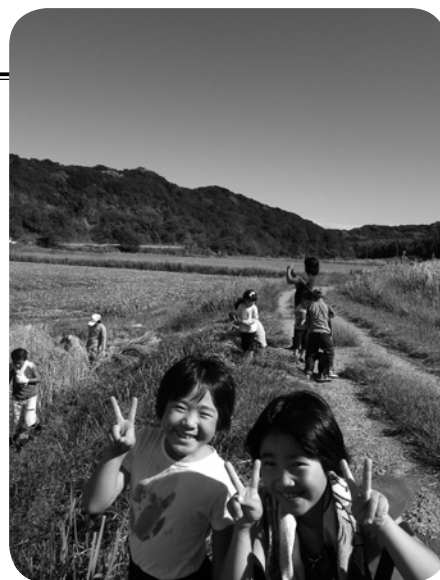
田畑・里山のいろいろな体験が待っている