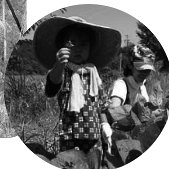
作物を取り巻くたくさんのいのちとの出会いを大切に