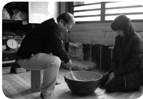
体験が家族が共に過ごす時間を生み出す

同じ地域に住む5歳児が子ヤギと一緒に大豆栽培を体験した3年後、小学校の先生が子どもたちの絵を見て「この学年は色の使い方がすごくきれい!」と誉めてくれた。描く絵で心の状態がわかるといわれるが、教育ファームでの経験が美しい色使いのできる一因になっていると思う。参加者のコメントそのものが一番の成果になっている。