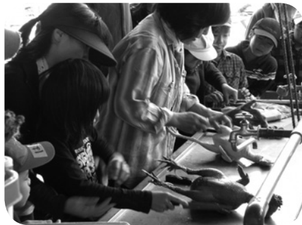
鶏のいのちをいただく(4頁参照)

鶏については、さばき体験などを行ない、通常認識することのない「いのちを食べて生きている」ということについて、参加者に深く考えさせる内容となっている。