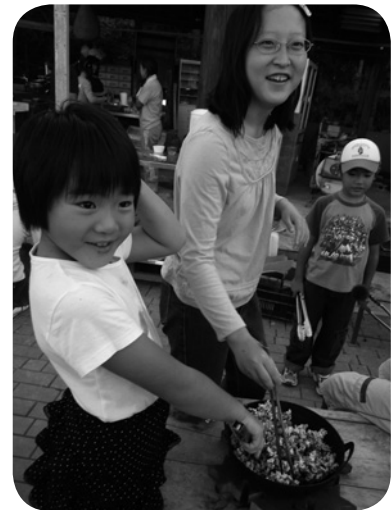
体験・触れ合いをとおして柔らかな心を