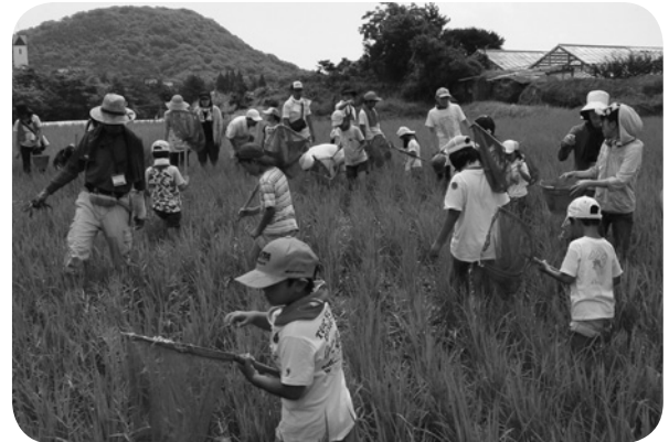
田んぼの生きもの探し