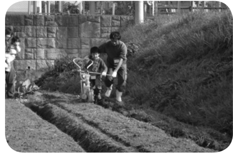
ホウレンソウの種まき