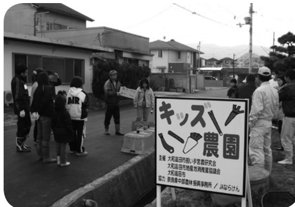
「キッズ農園」の看板