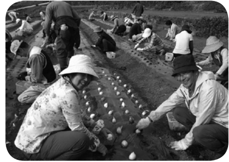
にんにくの植え付け

地域生産者の高齢化や後継者不足により農作業の負担が年々大きくなっており、地域の農業が衰えてきていることが問題。「農業塾」を活用し、塾生たちでこのような農家を応援する態勢をつくる必要があると考えている。