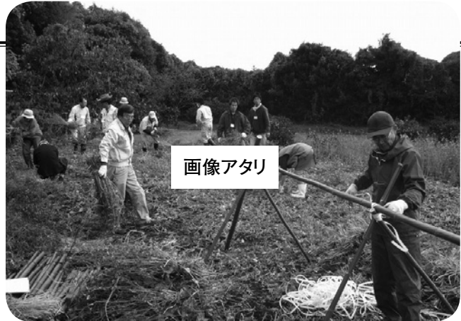
おおむら夢ファームシュシュの活動風景