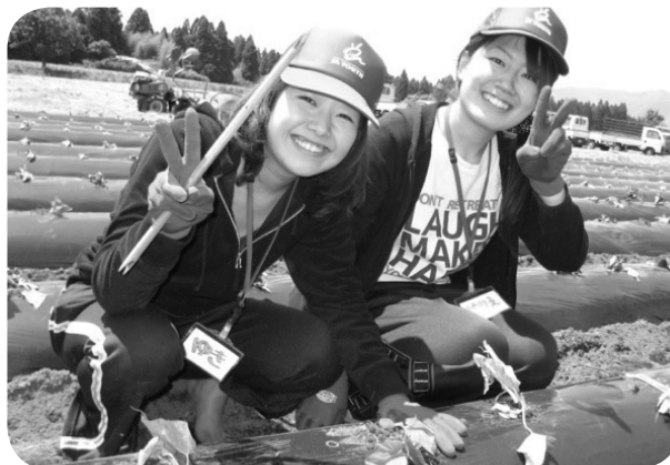
食の専門家を目指す学生たち