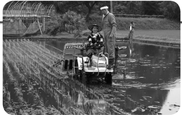
コンバインでの田植え体験