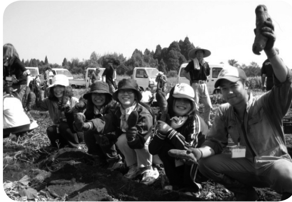
青年部の意識も高まる