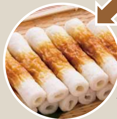
◀ちくわの完成！できたてはおいしいよ！