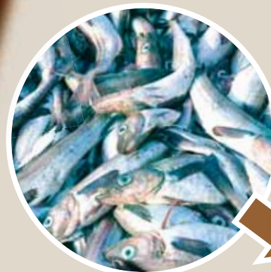
▲どのような食べ物に変身するのかな？