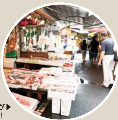
新鮮な魚がズラリ！