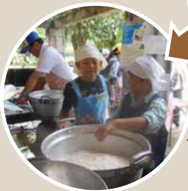
◀おいしくできたかな？