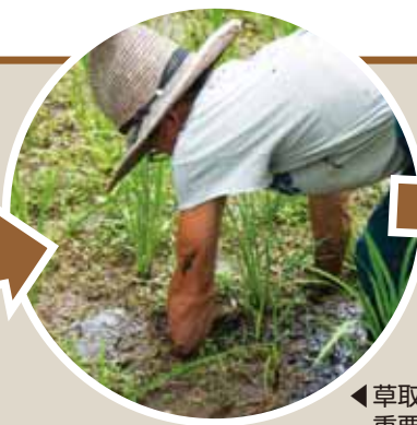
◀草取りも重要な仕事