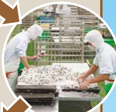
▲加工途中をのぞいてみよう