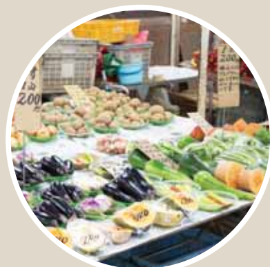
▲活気があって楽しい！