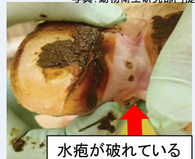
水疱が破れている