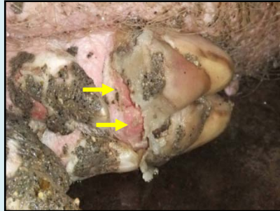
蹄部の水ぶくれの破れ