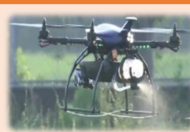
農業機械の導入 (1/2以内)