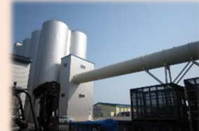
乾燥調製施設の整備 (1/2以内)