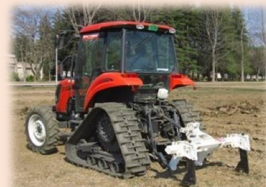
営農技術の導入 (定額)