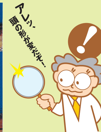
額角や触角の湾曲や変形がみられる（ホワイトレグシュリンプ）。