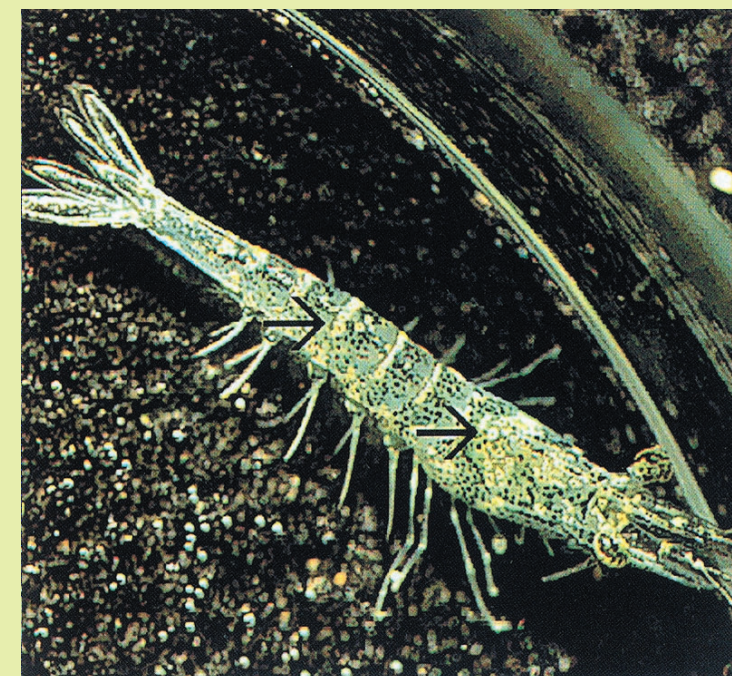
殻の継ぎ目に白または黄褐色の斑点がみられる（ブルーシュリンプ）。