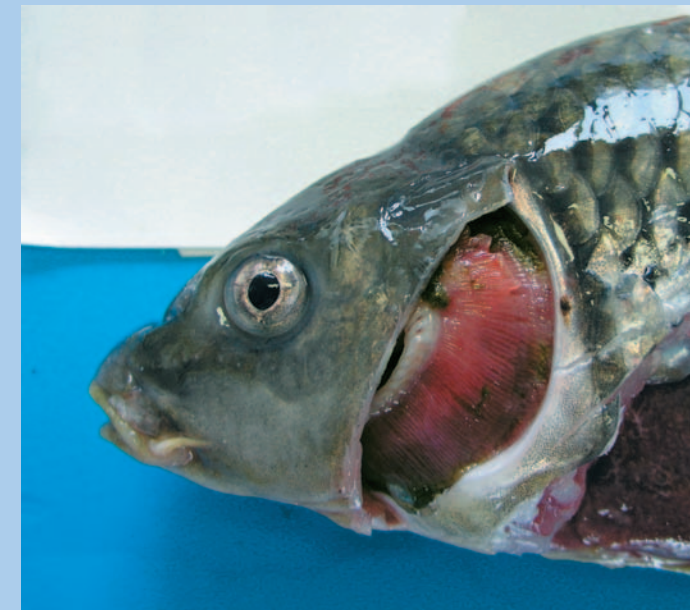
鰓が褪色し、汚物の付着や欠損がみられる(マゴイ)。