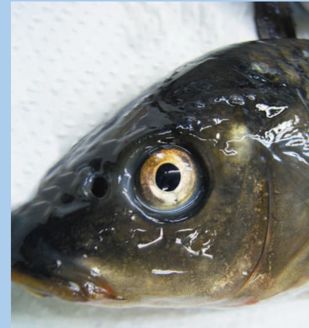
眼球や吻部が陥没し、粘液が過剰に分泌される(マゴイ)。