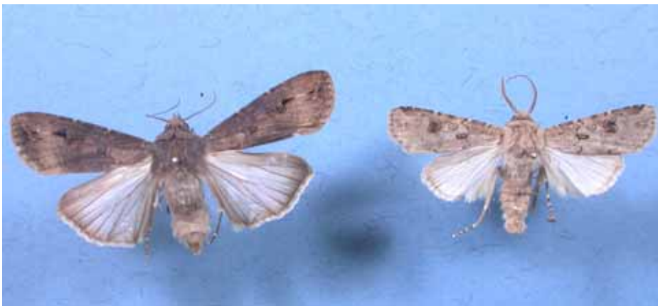
左:タマナヤガ成虫 (青木原図)