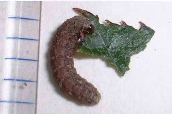
タマナヤガ幼虫 (青木原図)