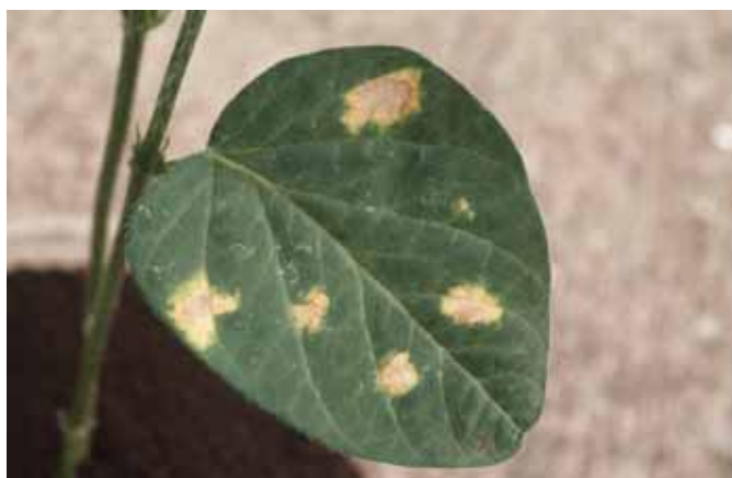
べと病菌の種子伝染で発病した幼苗