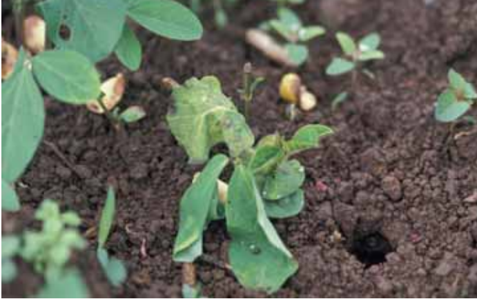
被害を受けた幼苗 (竹谷原図)