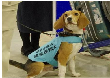
<検疫探知犬 (ギャリー号)>