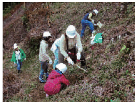
多様な主体の参画による森林づくり活動