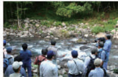
平成18年度に改良した箇所 の現地検討会