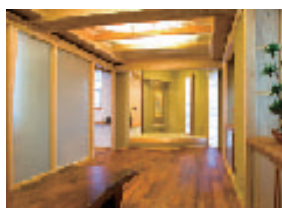
マンションの内装材