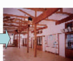
熱を小学校内の 暖房に利用