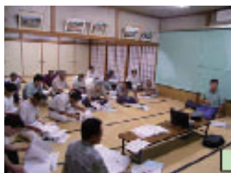
森林所有者に対する説明会

製材工場等の木材産業側にも、近年我が国の森林資源が充実しつつあることから、国産材を資源として見直す動きがみられます。このような提案型の取組によって国産材の安定供給が進めば、林業経営の改善や国産材の自給率向上にもつながりますので、大きな期待が寄せられています。