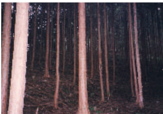
間伐が必要な状態の森林

平成20年7月には北海道洞爺湖においてG8サミットが開催されます。ホスト国である我が国に対しては、地球温暖化対策に関する議論を促進する観点から、リーダーシップを発揮していくことが期待されています。