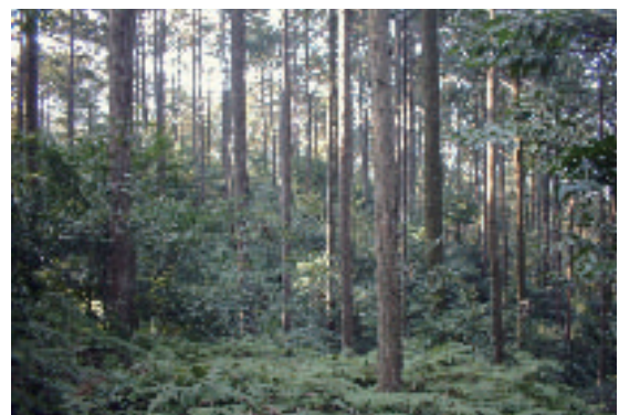
間伐が実施され健全な状態の森林