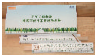
間伐材を利用した割り箸

このような取組により、環境に優しい資源として木材利用が一層拡大することが期待されます。