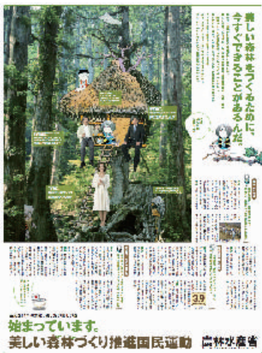
新聞広告を活用した広報活動

平成19年度は、①国民運動の認知度を高めるため、新聞広告の掲載や政府インターネットテレビ等での番組放送、各地方での緑化行事の参加者に対する国民運動の趣旨の説明等を行うとともに、②企業に対しては、国民運動への理解と協力を求めるために、森林づくり活動への参画の呼びかけ等を行いました。また、民間における取組として「美しい もり 森林づくり全国推進会議」が平成19年6月に設立され、地方においても国民運動を推進するための組織が設立され始めています。