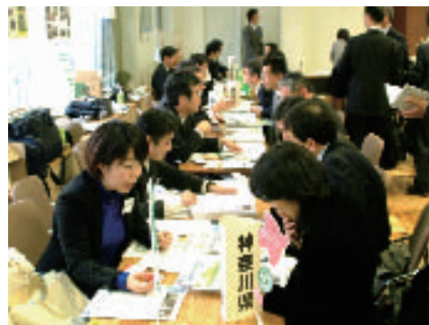
企業に対する森林づくり活動への参画の呼びかけ