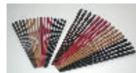
木質由来の バイオマスプラスチック