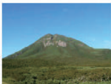
知床森林生態系保護地域内の 原始的な森林（羅臼岳）

このため、平成19年度からは、遺産地域周辺部を含めた地域において、「知床自然の森林づくり」を実施し、NPOや企業等から多くの参加者を得て、植生の回復を図るため、広葉樹林化をはじめとする多様な森林づくりを進めています。また、知床の森林特性を活かした多様な森林体験活動のメニューを作成し、来訪者や森林づくりの参加者に配布しています。さらに、知床森林センターを世界遺産の入口に位置する斜里町ウトロ地区に移転し、世界遺産を訪れる人々とのつながりを深めながら知床の森林の維持・保全を図ることとしています。