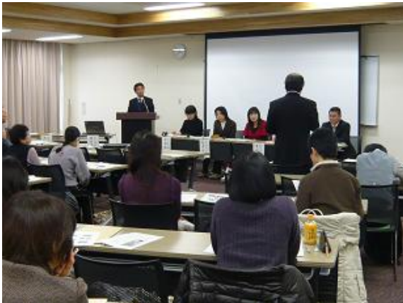
食べ物の味を知ってほしい

長野農政事務所地域第一課は2月16日、松本市庄内地区公民館の「庄内ふるさと“ほっと塾”」で、昨年来の消費者懇談会と食品表示セミナーに続き3回目となる食育学習懇談会を開きました。