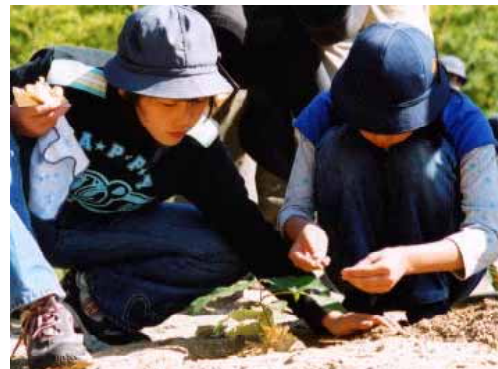
どんぐりの森小学校