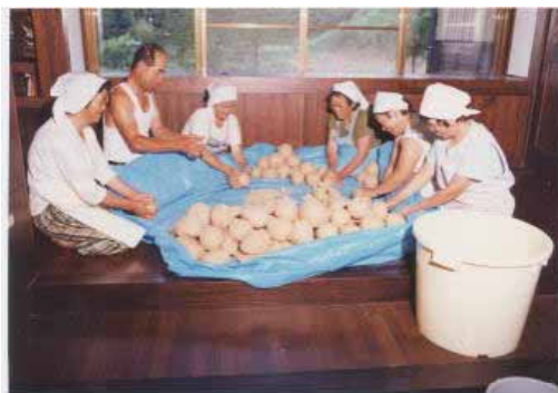
加工所でのみそづくり

新たな作目の検討から始まった活動が、高齢者・女性の能力を最大限に活かした農産物直売や加工の取組につながり、現在は「柿野沢生産者組合」(昭和61年設立：72戸)が主体となり、柿野沢区民センターに併設の加工所を利用して「母さんの手づくり味噌」、梅を始めとする加工品や、地域農産物を素材とした郷土色豊かな「久堅御膳」の提供を行っており、都会から来た人たちを、心のこもった食材でもてなしている。