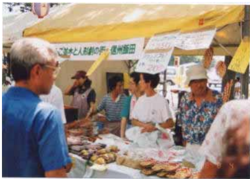
世田谷区民まつりへの出店

また、中学生などの体験教育旅行を平成8年から受け入れており、田植えや草刈り なかはた などの農業体験、五平餅づくりなどの食体験を行っている。平成12年からは、渋谷区中幡小学校と「どんぐりの森小学校」による交流を行っている。これは、子供たちがどんぐりから発芽させた苗を、柿野沢区の里山に植え、その子供が大人になった時、自分の子供を連れてこの地を訪れるといった次世代へつなげる取組である。