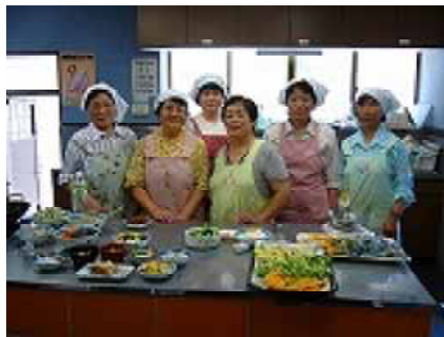
加工所で働く女性たち