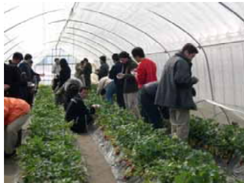
イチゴ狩りツアー