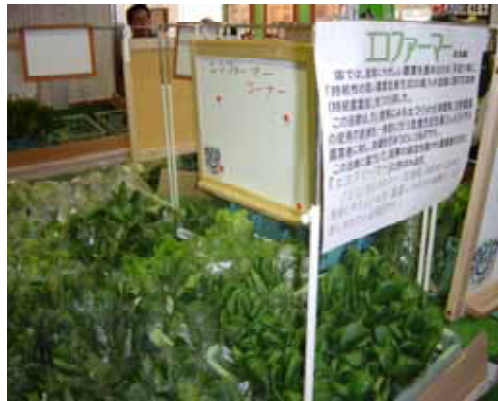
直売所内のエコファーマーコーナー