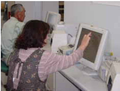
直売所で商品ラベルを作る生産者

従来から、食生活改善推進員グループや生涯学習事業等での味噌づくりや、畜産振興協議会ではハムづくりが女性を中心に毎年盛況に行われてきた実績を踏まえ、平成13年度に農畜産物処理加工施設「与一味工房」が整備され、会員女性等10名で発足した「味工房うまいもん」を中心に、自分たちで育てた野沢菜、大根、大豆等を使って、減塩の浅漬けや味噌等の開発・製造に取り組んでいる。