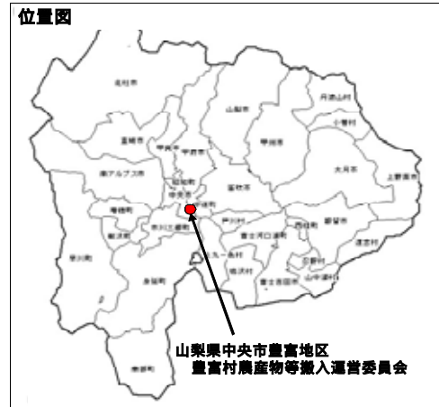
白地図KenMapの地図画像を編集