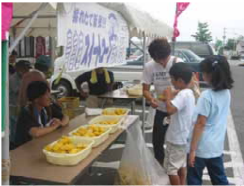
スイートコーン収穫祭

委員会設立当初から実施してきた「スイートコーン収穫祭」などのイベントを通して、会員は販路の拡大が図られることの喜びを体感し、積極的にのぼり旗を掲げ、ハッピーを着込んで、朝採りの新鮮さや、土づくり、農薬削減の取組などを、消費者にアピールするとともに、消費者から生の声を聴くなど、ふれあいを楽しみながら販売している。