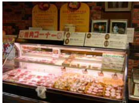
手づくりで人気の「とよとみハム」