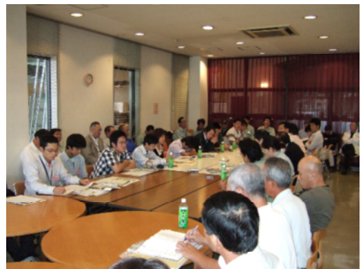
- 地元の方も交えての意見交換 -