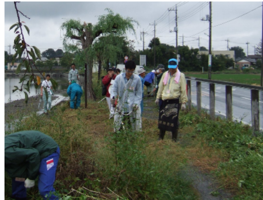
- 伊佐沼周辺での草刈り体験 -

その後、学生達は、川越市の農業ふれあいセンターの市民農園、農産物直売所、菅間頭首工、古谷上排水機場を視察。排水機場では、滅多に見ることのない機場の中の制御施設や大きなポンプを目の当たりにし、高い関心を示していた。