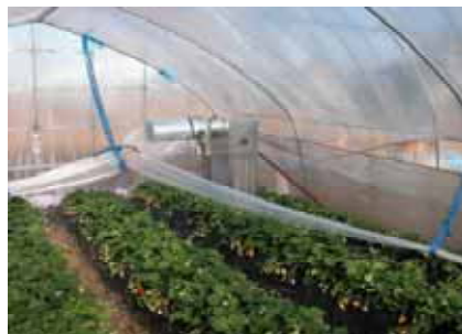
炭酸ガス発生装置