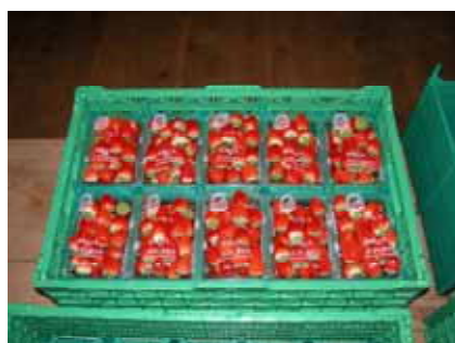
通いコンテナでの出荷