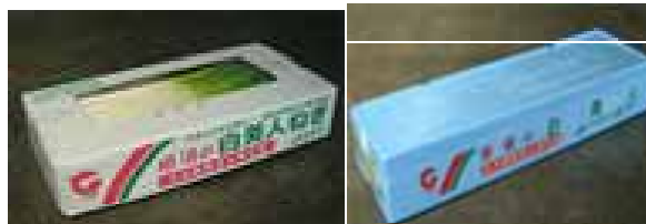
<写真4 露地ねぎ ハウス軟白ねぎ>