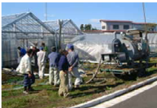
<写真2 蒸気による環境にやさしい土壌消毒>