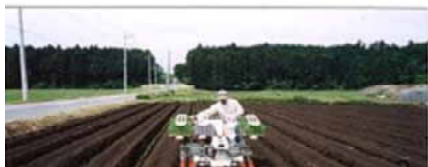
<写真3 機械化栽培体系（全自動播種機・定植機）>