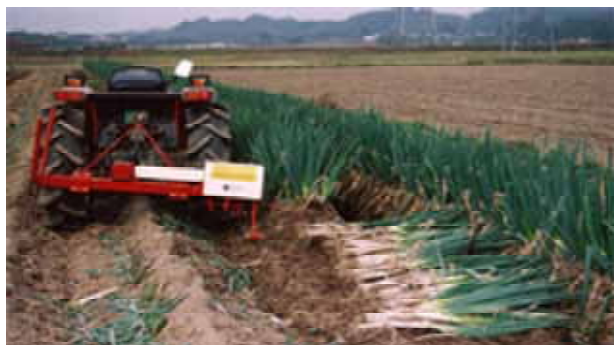
<写真1 掘取機によるネギ収穫>