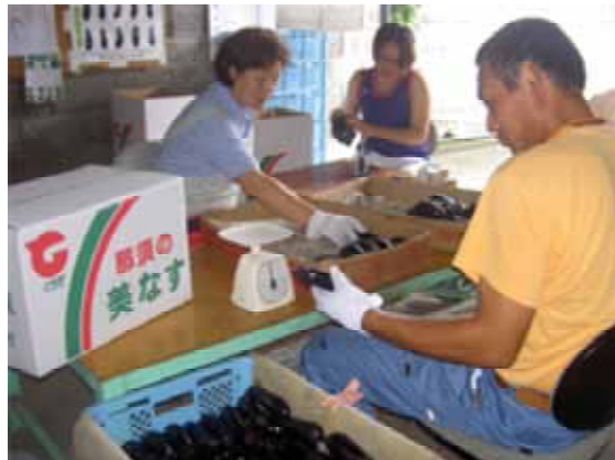
<写真2 段ボールコンテナでの出荷契約>