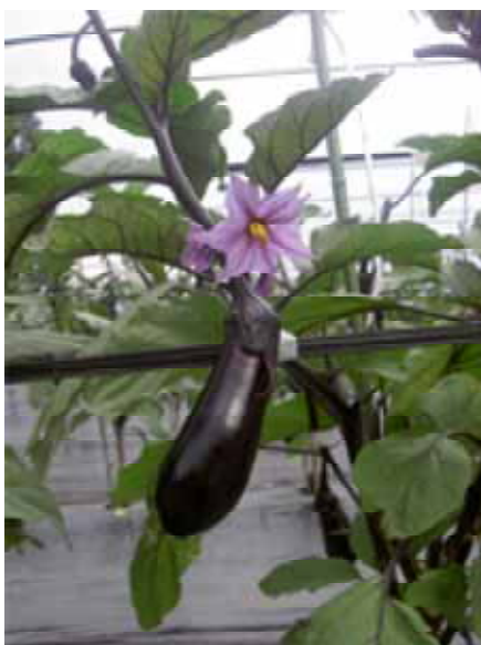
<写真3 「那須の美なす」>