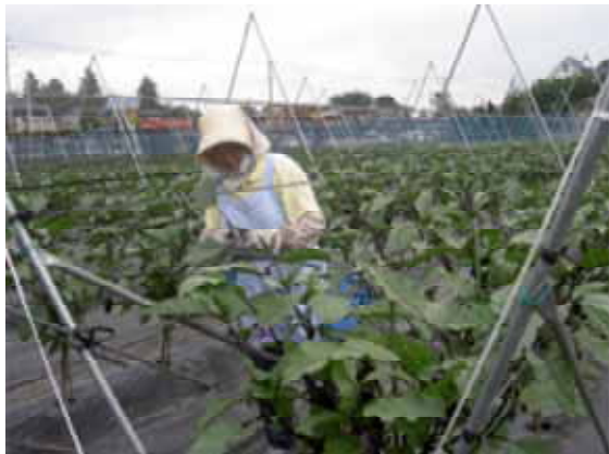
<写真1 収穫作業風景>