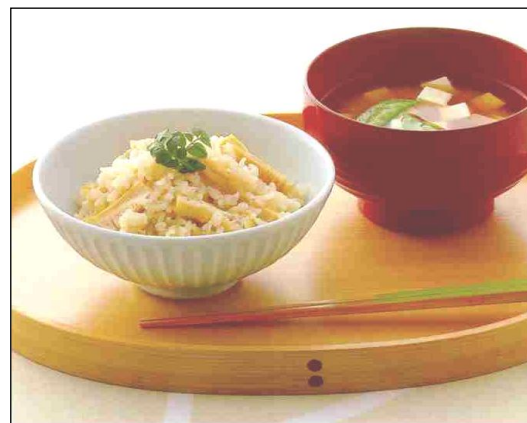
たけのこごはん（ごはんSAIJIKIより）