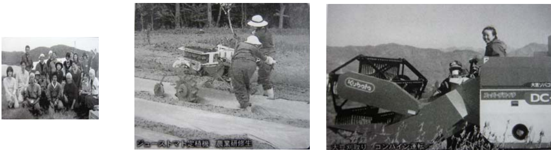
NPO農業実践塾における研修の様相。 (左) 研修生と撮影、(中) 定植機を使っているジューストマトの定植、(右) コンバインを使っている大豆の刈取り