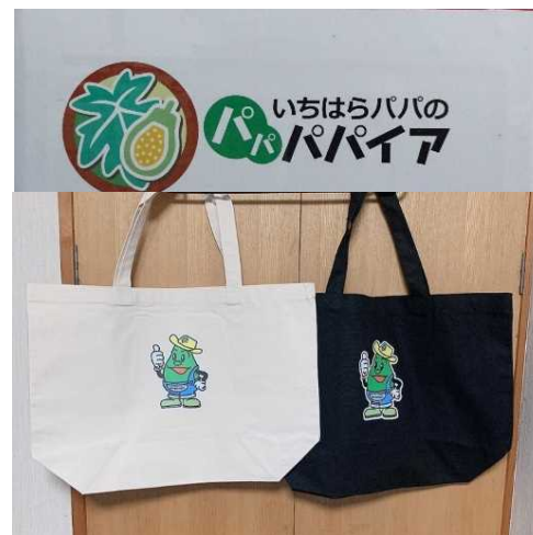
グリーンパパイヤロゴ & オリジナルバッグ