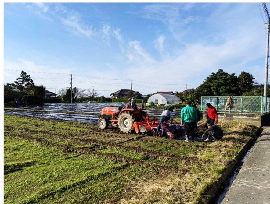
にんにく収穫状況