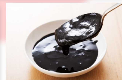
黒にんにくペースト(イメージ)