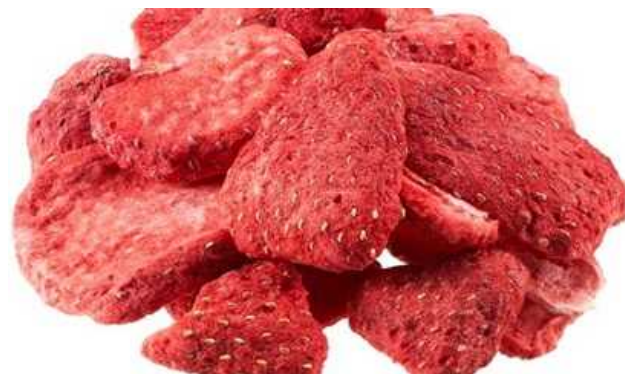
いちご フリーズドライ