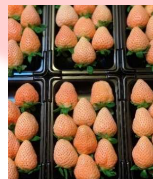
加工に使用する いちごの一例 (左:紅ほっぺ、 右:淡雪)