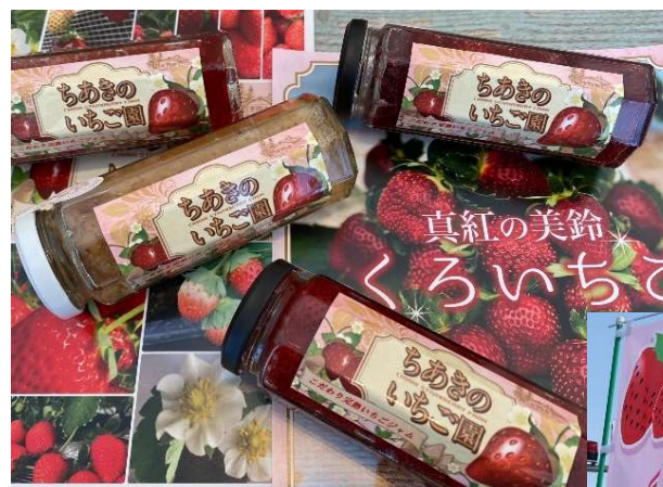
いちごジャム(高濃度タイプ)試作品

② 今後は、観光農園の規模を拡大し、来園者数の増加を図るとともに、人と人がふれあう地域の憩いの場となるいちご農園を目指す。