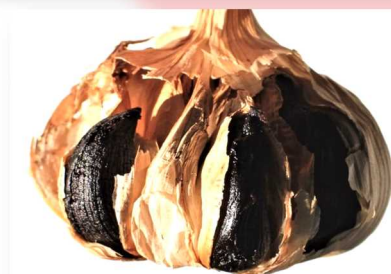
黒にんにく(イメージ)