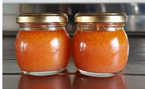
ドレッシング(ニンジン)試作品