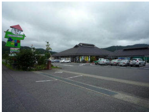
みんなみの里ホームページ

特産品のお米について、多くの加工品を紹介していますが、米粉についても、幅広い年代の方々に食べてもらえるようなケーキ類の販売に力を入れています。ぜひ、ご賞味ください。