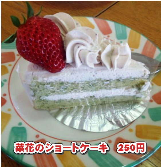
菜花のショートケーキ 250円