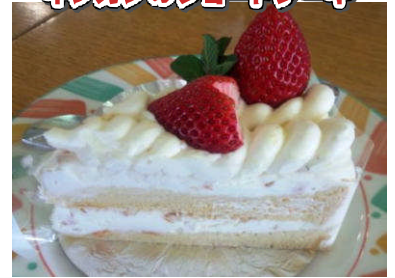
米粉ケーキいっぱい! 各250円