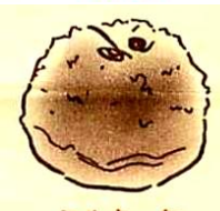
ミルクィーな カマンベールチーズ ¥231