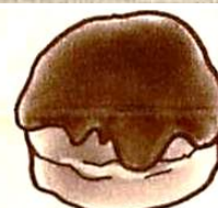
ショコラ・カスタード ¥210